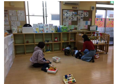
liwasan ng magulang at bata