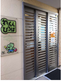
왓쿤 히로바 입구

유치원에 들어가기 전 연령인 영유아기 자녀와 엄마와 아빠가 함께 즐길 수 있는 「보금자리」로서 요코하마시의 각 구에 있는 육아 지원 거점. 츠루미구에는 「왓쿤 히로바」와 「왓쿤 히로바 새틀라이트」가 있습니다. 이번 회에는 도요오카쵸에 있는 「왓쿤 히로바」를 소개합니다.