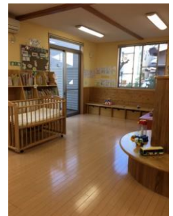
ひろばの奥には本棚も