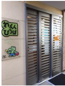
わっくんひろばの入り口

あかちゃんから幼稚園に行く前のお子さんとママやパパが一緒に過ごせる「居場所」として横浜市のそれぞれの区にある子育て支援拠点。鶴見区には「わっくんひろば」と「わっくんひろばサテライト」があります。